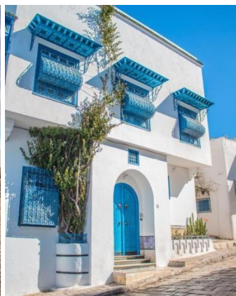
Sidi Bou Said